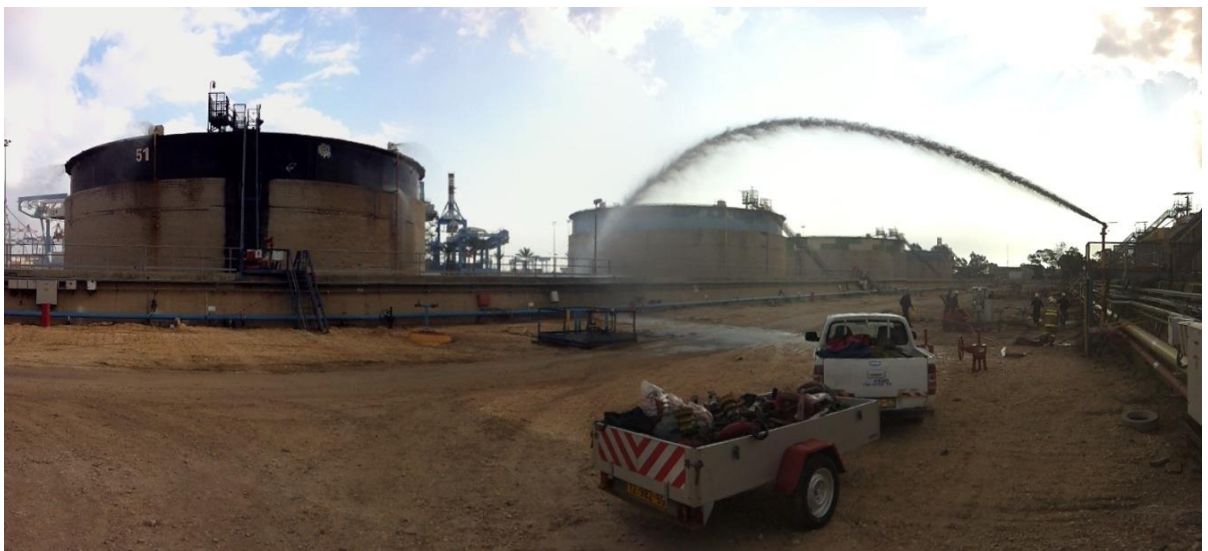
תרגיל בחבי תשי"ן נמל הדלק