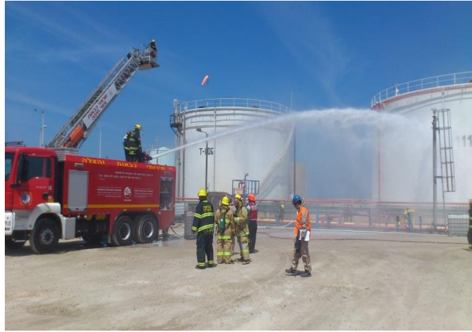
תרגיל במפעל דור כימיקלים