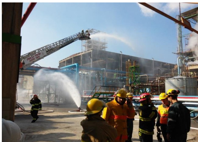
תרגיל למפעל חיפה כימיקלים