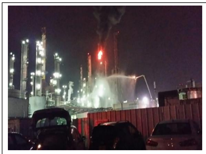
שריפת קסילן בתנור מפעל גדיב