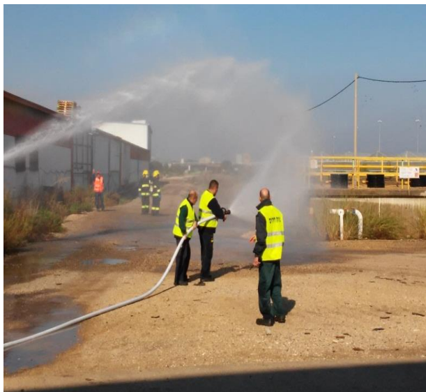
תרגיל במפעל לגין