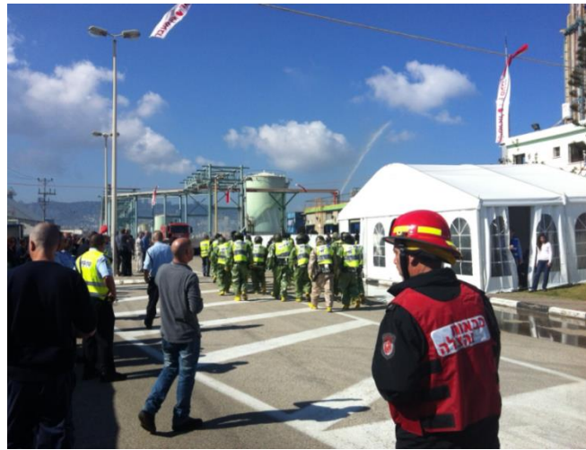
תרגיל במיכל אמוניה במסוף