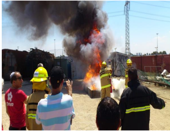
תרגיל במפעל סונול