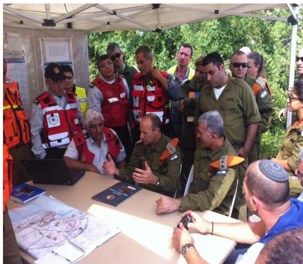
מטה חירום בתרגיל פקע"ר במפעל דשנים