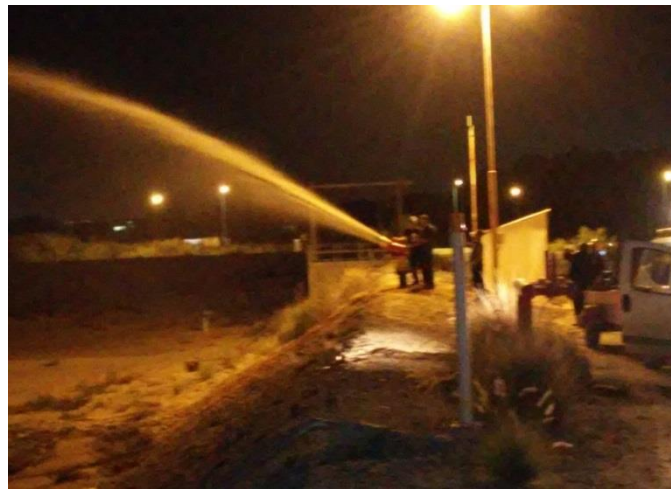
תרגיל לילה בחבי תשי"ן חוות ק. חיים