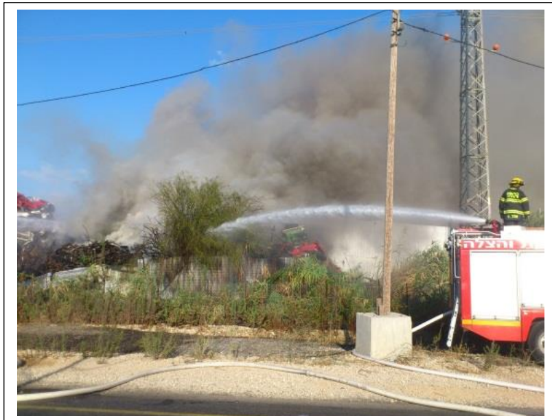
שריפת גרוטאות בחוף שמן