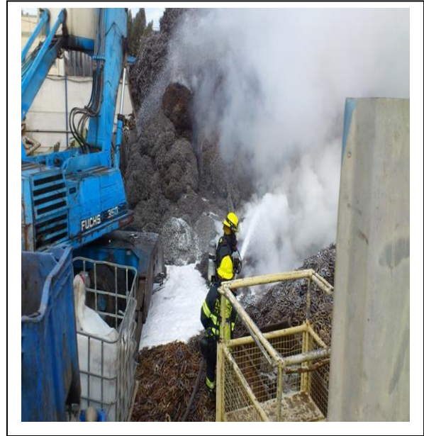
שריפת שבבי טיטניום במפעל מרקוביץ, ק. אתא