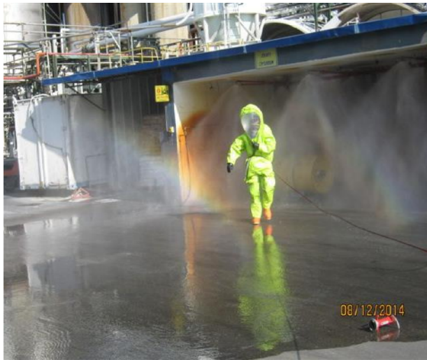
תרגיל במפעל גדות ביוכימיה