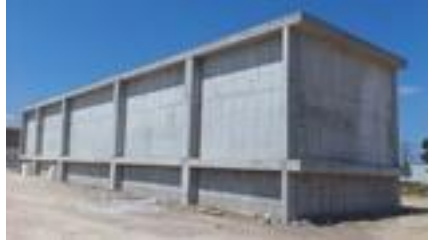
איור : מצב צובר של סופרגו בעת הסיור 28.08.14